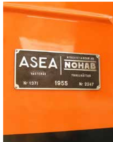
Tillverkarskylt efter rengöring och återmontering.