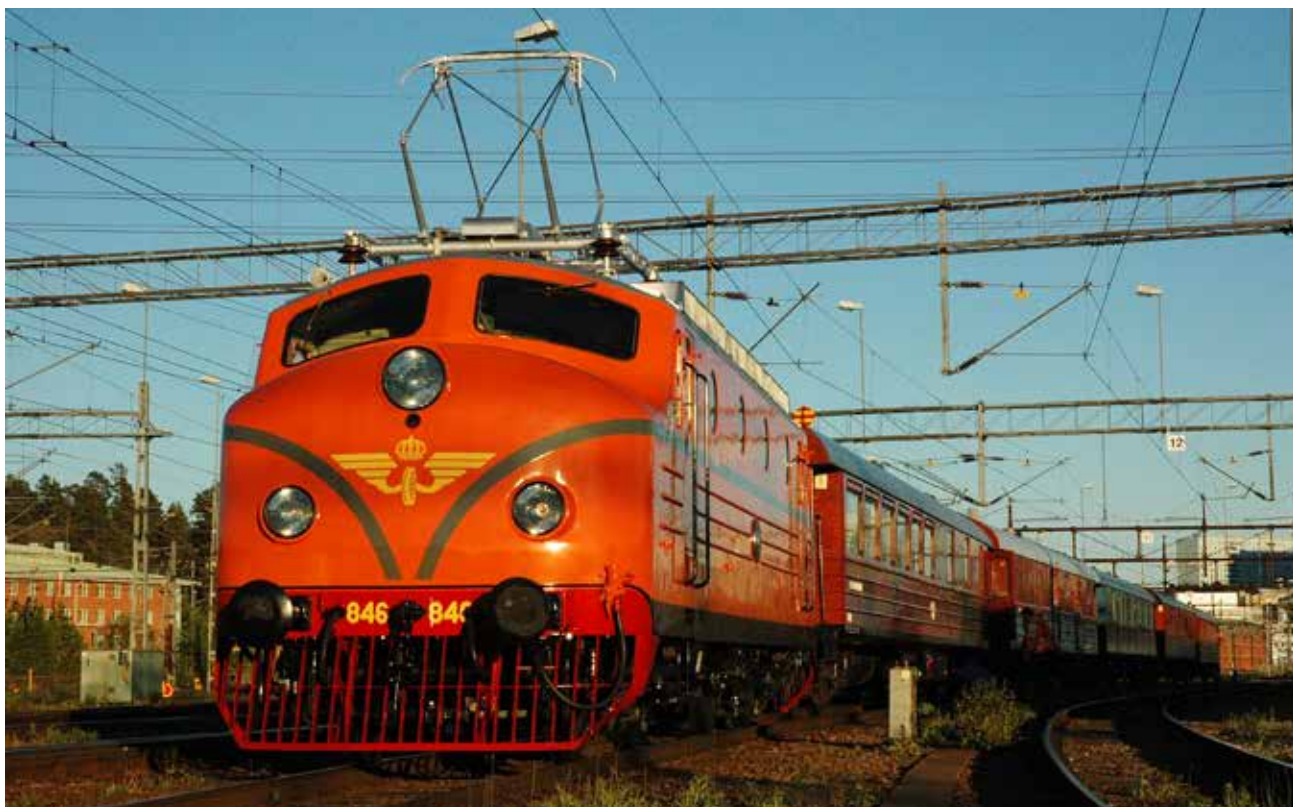
Rapidloket drar Årgångståget.