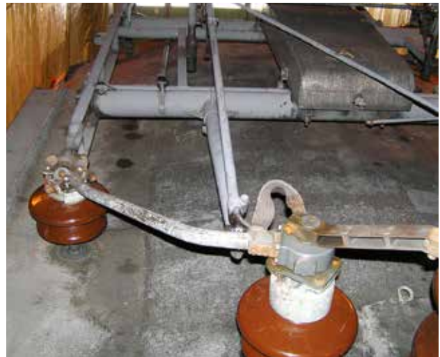
Taket innan restaureringen med strömavtagaren.