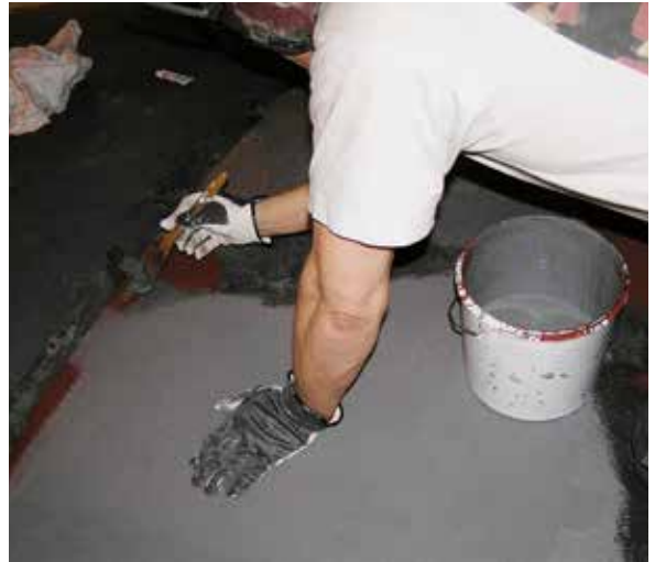
Målning av taket.