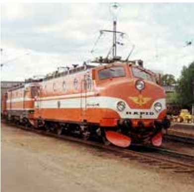
Ra 846 fotograferad 1969.

Boggierna var i behov av reovering och hjulen var i dåligt skick. Loket var i behov av elteknisk revision. Elmotorerna behövde ses över. Ytbehandlingen på korgen var eftersatt. Både ytbehandlingen och färgsättningen hade förändrats under åren. När restaureringen började uppvisade loket stora ojämnheter och skador på korgens yta. Lyktorna på loket var utbytta på 1970-talet till en mindre modell. Det var oljeläckage från rörflänsar på huvudtransformatorn och kompressorn var i behov av reovering. Banröjarna var av en senare modell, troligen från år 1964.