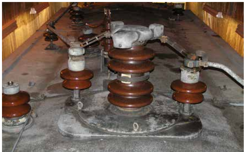
Taket innan restaureringen efter att strömavtagaren demonterats.