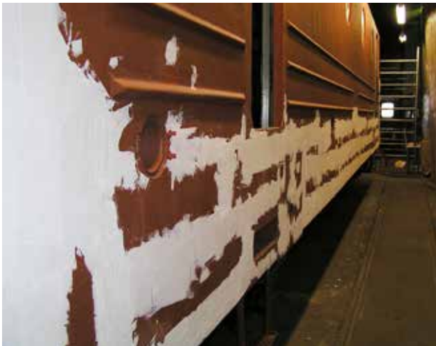
Spackling av korgen.