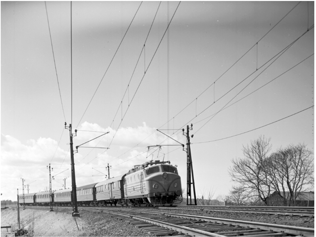
Ra 847 år 1955, Foto: Samlingsportalen Jvm KBDB03482.