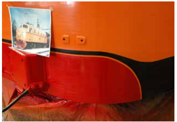
Detalj av färgsättning på fronten.