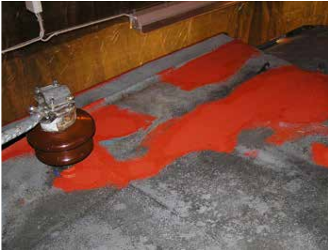
Rostskyddsbehandling av taket.