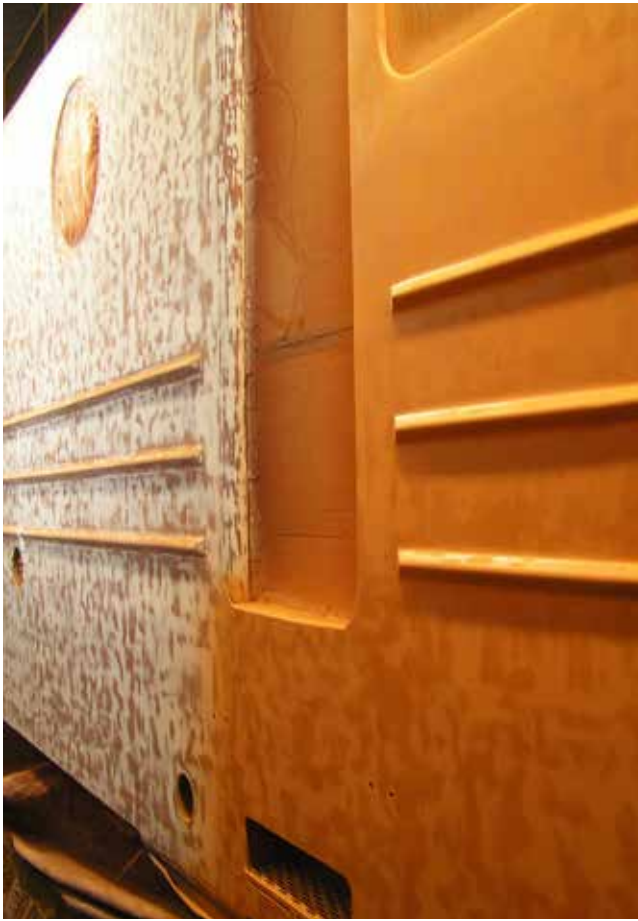
Främre delen har sprutmålats en gång.