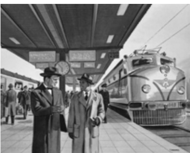
Teckning till annons för SJ 1958, Foto: Samlingsportalen, Jvm KBDB06169.