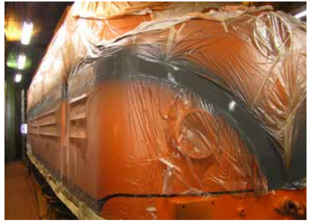
Målning av grå dekorlinje.