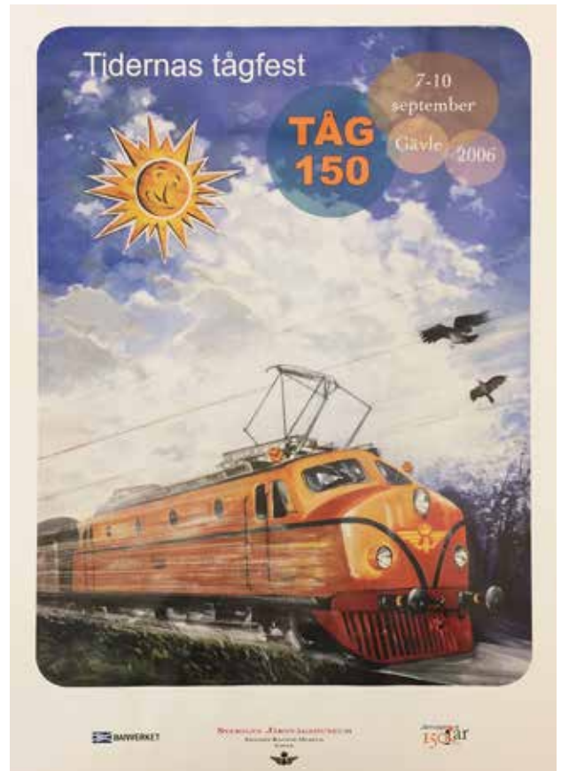
Rapidloket på affisch till järnvägens 150-årsjubileum 2006. Design: Thomas Sandström.