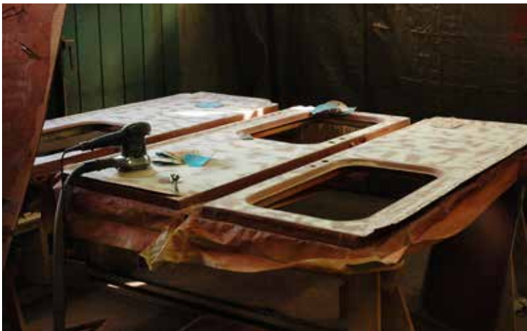
Spackling och slipning av dörrar.