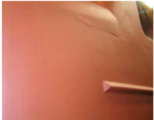
Korgen innan ytbehandlingen med märken och ojämnheter.