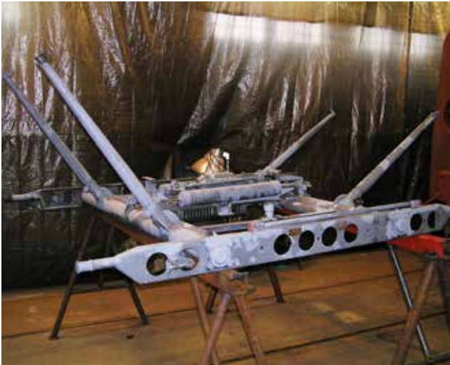
Strömavtagaren innan målningen.