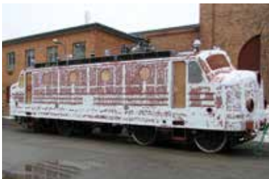
Spackling av korgen.