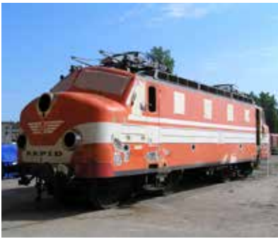
Efter att lykthållarna är omgjorda och innan den övriga restaureringen är påbörjad.

Korgen sandblästrades och spacklades i tio omgångar. Blästringen och grundmålningen gjordes i Euromaints verkstad i Notviken, Luleå, medan spacklingen gjordes i restaureringsverksamheten på Sveriges Järnvägs-museum. De första omgångarna gjordes med bredspackel och det avslutande med Jotuns alkydspackel. Mellan varje spackling slipades ytan. Till rostskydd på de mest utsatta ytorna användes International rostskyddsfärg CP192 Röd (zinkkromat), som sprutades i två lager. Hela korgen sprutades med samma rostskyddsfärg. Därefter sprutmålades korgen i två omgångar med en orange alkydfärg som togs fram på Ottossons Färgmaleri AB, efter tidstypiska recept. Mellan lagren slipades ytan. Som avslutning klarlackades korgen med två strykningar linoljebaserad fernissa för att åstadkomma den blanka ytan. Loket återfick sin ursprungliga färgsättning med grå dekorlinje och gult bevingat hjul. Kulören togs fram med hjälp av en färglikare från SJ daterad 1959 – kulör O, Röd 81.